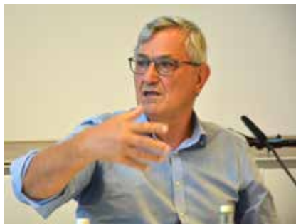
Abb. 6: Bernd Riexinger (MdB DIE LINKE)

Unternehmern, Arbeitnehmervertretern und Verbrauchern zur Steuerung der Produktion zusammenwirken. Auch in den Wirtschaftspolitischen Grundsätzen des DGB aus dem Jahr 1949 finden sich neben der Forderung nach Mitbestimmung im Betrieb Gemeineigentum und volkswirtschaftliche Rahmenplanung als weitere Erfordernisse einer demokratischen Wirtschaft. Abgeschwächt finde sich diese Idee selbst noch im DGB-Grundsatzprogramm von 1996, wenn dort proklamiert wird, den Gewerkschaften gehe es darum, mitzuwirken bei «Entscheidungen der Gesellschaft, wie sie leben, arbeiten und wirtschaften will.» Ein weitreichender Ansatz zur sozialverträglichen Bewältigung der europäischen Stahlkrise in den Neunzehnhundertachtziger Jahren war das «Stahlpolitische Pro-