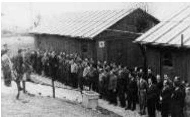
Appell im Arbeitslager Gordola/ Schweiz 1941

Machtübertragung an Hitler. 1934 und 1935 sitzt er wegen „schwerem Landfriedensbruch“ im Gefängnis. Er kann in die Schweiz fliehen und kämpft ab November 1936 in Spanien im Tschapajew-Bataillon* gegen Franco und die Nazi-Söldner der „Legion Condor“. Er wird 1937 verwundet und im April 1938 nach Frankreich evakuiert.