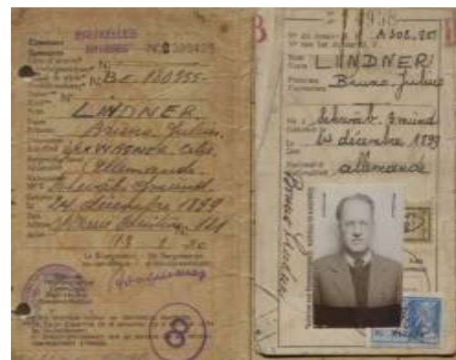
Ausweis der Stadt Brüssel für den Bezug von Lebensmittelkarten (Januar 1940)