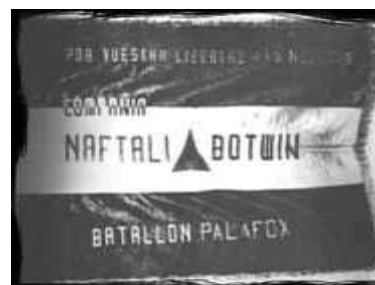
Armbinde der Angehörigen der Naftali- Botwin- Kompanie