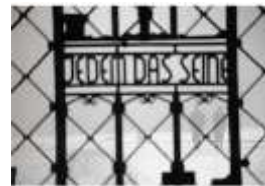
zynische Parole am Tor des Konzentrations- lagers Buchenwald

Ab Oktober 1936 ist er in Spanien im Sanitätsdienst der Thälmann-Brigade*. Der SIM*, der Geheimdienst der Internationalen Brigaden, verhaftet ihn wegen des Verdachts der Spionage, er wird zum Tod verurteilt, später zu 30 Jahren Gefängnis begnadigt und 1939 von Francisten aus dem Gefängnis Totana befreit. Nach der Internierung in dem Lager Argelès in Südfrankreich kehrt er 1940 nach Spanien zurück und wird ans „Reich“ ausgeliefert. 1941 wird er zu 4 Jahren Zuchthaus „verurteilt“.