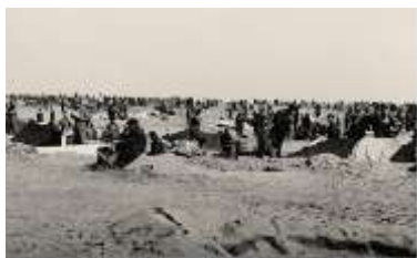
Lager St. Cyprien 1939

Häberle, Eugen ist 1911 in Bietigheim geboren. Im April 1937 kommt er über Frankreich nach Spanien. Er wird Panzerfahrer in einer Panzerbrigade und bei einem Gefecht am Ebro im Februar 1938 verwundet.