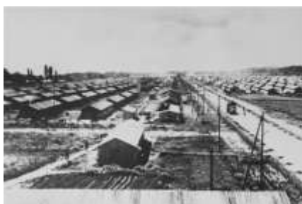
Lager Gurs 1940